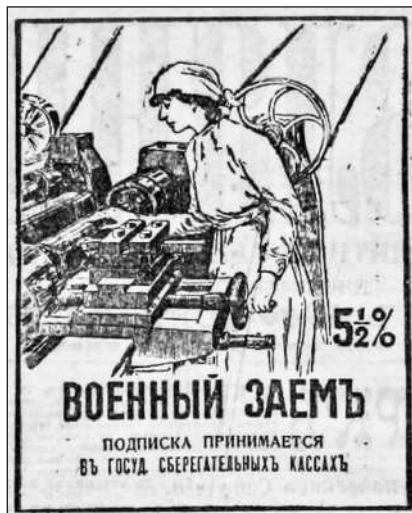
Рис. 10. Військова 5½% позика. Передплата приймається в державних ощадних касах. (Газета «Киевлянин», 29 листопада 1916 р. № 331. С. 2)