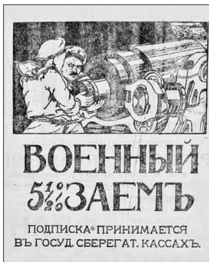
Рис. 8. Військова 5½% позика. Передплата приймається в державних оцадних касах. (Газета «Киевлянин» 28 квітня 1916 р. № 117. С. 2)