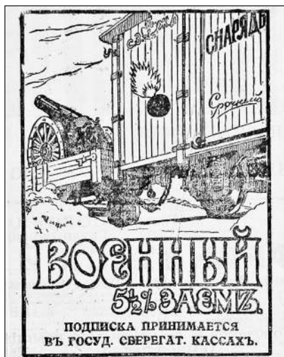
Рис. 9. Військова 5½ % позика. Передплата приймається в державних оцадних касах (Газета «Киевлянин». 29 квітня 1916 р. № 118. С. 2)

1916 р., на якому представлено жінку за роботою на верстаті 1 , що підкреслювало цінність жіночої праці в тилу та ідею гендерного підходу у виконанні громадянського обов'язку (Рис. 10).