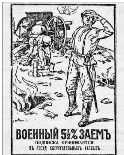
Рис. 11. Військова 5½% позика. Передплата приймається в державних ощадних касах (Газета «Киевлянин», 17 грудня 1916 р. № 349. С. 2)

пропагандистських цілей. Як відзначав німецький спеціаліст з історичної фотографії Бодо фон Девіц, багато світлин Першої світової війни, які стали частиною історичних записів, насправді не показували того, про що йшлося в підписах. Підроблені фотографії були своєрідним прийомом, які демонстрували інсценізовані сцени з лінії фронту або з фільмів (цит. за: Allen, С. 2014).