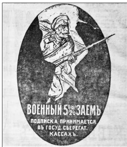
Рис. 6. Військова 5½% позика. Передплата приймається в державних ощадних касах (Газета «Киев». 12 листопада 1916 р. № 1018)