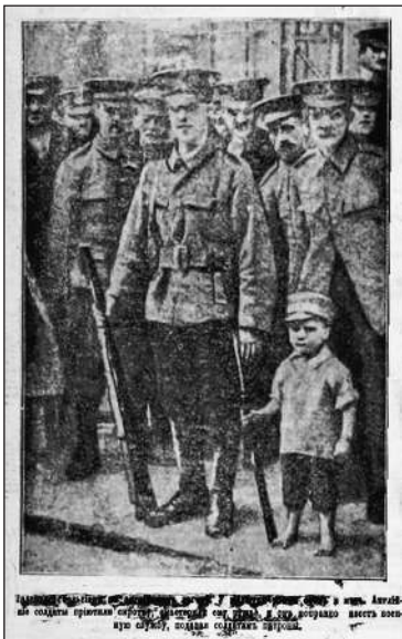
Рис. 16. Англійські солдати прихистили сироту, змайстрували йому зброю, і він вправно несе військову службу, подаючи солдатам патрони (Газета «Киевлянин», 19 жовтня 1914 р., № 289. С. 2)

Геройской Бельгии малютку-сироту Пригрѣли ласково союзные солдаты, И онъ воинственно, какъ ратникъ на посту, Стоитъ съ винтовкою средь нихъ молодецкато... — На немъ отечество сказалося все сполна,— Такое жъ малое, но полное отваги, Оно безрешетно, лишь началась война, Съ большимъ противникомъ скрестило смѣло шпаги... — И, имъ разбитое, теперь, какъ сирота, Къ сосѣдямъ доблестнымъ пришло искать опоры... И та жъ свободная живить его мечта, И тѣмъ же мужествомъ горить отважно взоры... — И вы возстанете, бельгийскіе края!.. Залогомъ творчества вернется къ вамъ свобода И ею впишутся въ скрижали бытія Иные подвиги безсмертнаго народа!.. Н. Архангельскій.