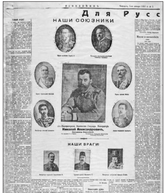
Рис. 12. Наші союзники. Наші вороги (Газета «Киевлянин». 1 січня 1915 р. № 1. С. 4)

Оскільки на законодавчому рівні заборонялося розповсюджувати фотографії, які б стосувались армії та висвітлювали події на фронті, то більшість опублікованих світлин були статичні. В зв'язку з цим, поширеним було розміщення в індивідуальному чи груповому форматі анфасних портретів членів імператорської родини, генералів фронтових армій, військових героїв, очільників союзних держав та ін. Яскравим прикладом подібного контенту є матеріал, опублікований у газеті «Киевлянин» від 1 січня 1915 р. На четвертій сторінці видання було розміщено групову серію фотопортретів тогочасних політичних лідерів держав (Рис. 12). Цікавим є саме спосіб розміщення зображень, які розділені на два блоки, що уособлюють два антагоністичних табори: «наші союзники» (Антанта) та «наші вороги» (Троїстий союз). У першій групі по центру розташований портрет російського імператора Миколи II, а навколо нього: король Англії Георг V, президент Франції Раймон Пуанкаре, король Румунії Нікола I Петрович-Негош, король Сербії Петро I Карагеоргійович, імператор Японії Тайсьо (Йосіхіто) та король Бельгії Альберт I. У таборі «наші вороги» представлені імператор