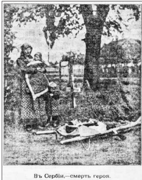
Рис. 18. В Сербії, — смерть героя (Газета «Киевлянин», 3 січня 1915 р. № 3. С. 2)