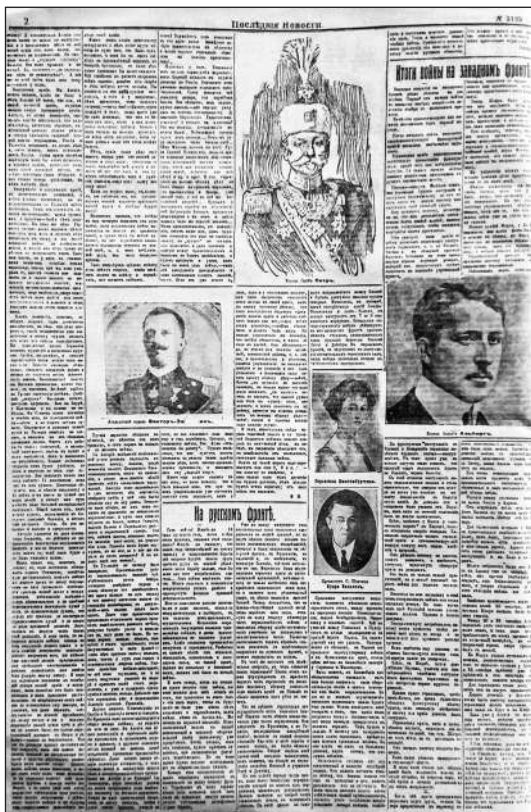
Рис. 14. Продовження рубрики «Річниця великої війни» (Газета «Последние новости». 19 липня 1915 р. № 3195. С. 2)

Окрім портретів, у пресі розміщувалися й інші фотографії, які стосувалися війни. Проте їх публікація була зумовлена радше пропагандистськими цілями, аніж потребою висвітлити реальні події на фронті. Так, окремі знімки, попри прозаїчність, підкреслювали варварську суть поведінки німців не тільки щодо підкореного населення, але й щодо культурної спадщини минулого. Зокре-