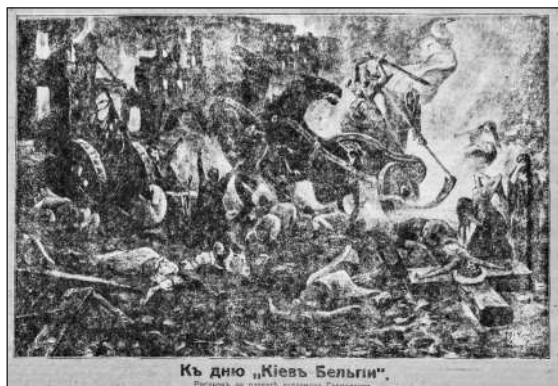
Рис. 3. До дня «Київ — Бельгія». Малюнок академіка Галимського (газета «Киевлянин», 25 листопада 1914 р., № 326)

Німеччина займала «темний бік» та символізувала поширені в суспільстві стереотипні уявлення про смерть, яка як правило постає у вигляді хмурого женця (англ. Grim Reaper) або старої кістлявої жінки з косою (Кирпа).