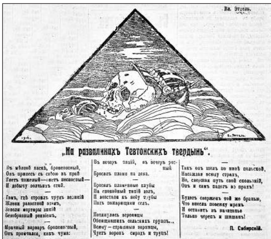
Рис. 1. «На руїнах Тевтонських твердинь» (Газета «Последние новости». 4 листопада 1914 р. № 2693)

Формування негативного образу ворога було одним із пріоритетних завдань загальноімперської пропаганди. Через це, перебуваючи під жорстким контролем з боку влади та цензурних органів, засоби інформації активно поширювали матеріали про численні звірства німців та їх союзників щодо підкорених народів. 13 грудня 1914 р. в газеті «Последние новости» було опубліковано ілюстрацію (Рис. 2) про жажіття австро-угорського вторгнення до Сербії 3 . На ній зображено австрійських солдатів, які стоять поряд із купою мертвих тіл мирних сербів, тим самим наголошуючи на аморальності та злочинності дій ворога.