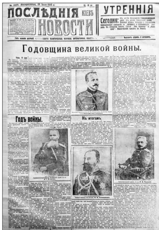
Рис. 13. Рубрика «Річниця великої війни» (Газета «Последние новости». 19 липня 1915 р. № 3195. С. 1)

ва; військового міністра, генерала Олексія Поліванова та головнокомандувача армій північного фронту, генерала Миколи Рузького (Рис. 13). На другій сторінці газети розміщено портрети закордонних лідерів-союзників (Рис. 14), зокрема: короля Сербії Петра I Карагеоргійовича, італійського короля Віктора Еммануїла III, великої герцогині Люксембурзької Марії-Аделаїди, президента Сполучених Штатів Америки Вудро Вільсона та короля Бельгії Альберта I 2 .