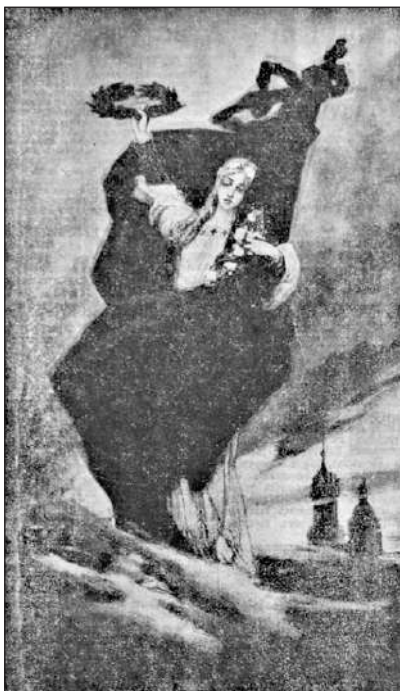
Рис. 4. Ілюстрація (газета «Киевлянин», 2 листопада 1914 р., № 303, с. 2)