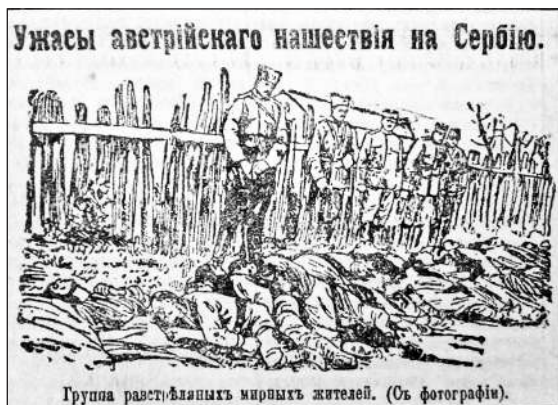
Рис. 2. «Жахіття австрійського нашествія на Сербію. Група розстріляного мирного населення» (Газета «Последние новости». 13 грудня 1914 р. № 2771)