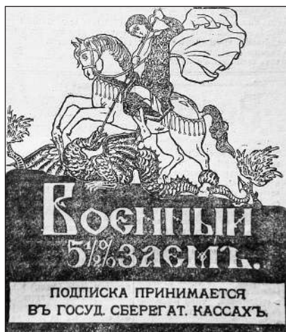
Рис. 7. Військова 5½% позика. Передплата приймається в державних ощадних касах (Газета «Последние новости». 4 квітня 1916 р. № 371)

людей до купівлі державних облігацій під відсоток, в пресі редактори розмищували різноманітні ілюстративні публікації з закличками долучитися до військової позики (Рис. 6 та 7). Серед них, найпоширенішими були зображення солдата 1 та Георгія Змієборця 2 . Образ останнього мав значне пропагандистське навантаження, оскільки містив релігійний та ідеологічний компоненти. По-перше, Святий Георгій займав одну із ключових позицій у пантеоні святих православної церкви, а тому поціновувався як серед цивільного населення, так і серед армійського середовища. По-друге, завдяки активній пропаганді образ святого асоціювався з Росією, а змії — з Німеччиною, яку очікує падіння від ударів списа.