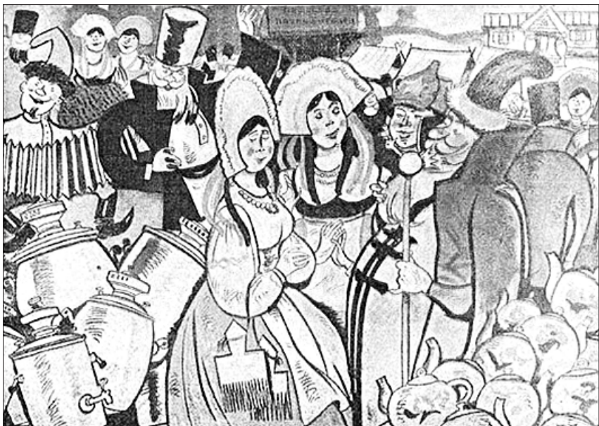
«Базар на Україні» Асоціації художників революційної Росії і «Базар в РСФРР» у виконанні Б. Фрідкіна. На замовлення редакції «Червоного перця» (1928 р.)