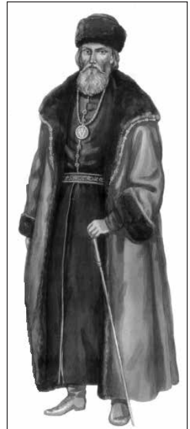
Рис. 4. Еліта XVI ст. у жупани та шубі. Художня реконструкція З. Васіної (Васіна, З. 2006, с. 79)

Як бачимо, для пошиття верхнього одягу використовували різні варіанти хутра . Згідно з уставою 1563 р. на волинські ринки потрапляли вироби з хутра та шерсть диких тварин: лосів, оленів, медведів, вовків, зубрів, козиць (серна), соболів, куниць, рисів, лисів, білок, росомах 1 . Враховуючи, що 1545 р. декілька сіл Луцького повіту платили податки білками й лисом (Кравченко, В., підг. 2005, с. 178), їхнє хутро часто мало місцеве походження. Особливо цінними вважалися соболі, чорні лисиці, бобри, рисі і навіть вовки (Matuszakaitė, 2011, p. 63; Бялявіна, В. & Ракава, Л. 2007, с. 20). Шили кожухи з кроликів 2 . Проте продукти мисливства були дорогим матеріалом для одягу, тож популярнішими серед міщан були вироби з хутра чи шкіри домашньої худоби. Ймовірно, з цієї причини в гардеробі міщанства не було верхнього вбрання, підбитого повністю хутром ведмедя чи горностая, як у шляхти (Чубик, Ю. 2011, с. 271).