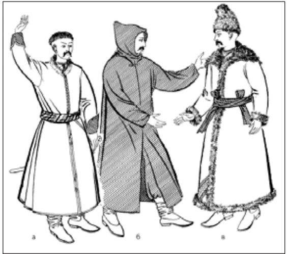
Рис. 3. Верхній чоловічий одяг.

Делії, ймовірно, були привнесеним елементом від турків (Бялявіна, В. & Ракава, Л. 2007, с. 146). Їх кріпили на правому плечі прикрасою чи шнурами, або фіксували під шиєю (Чубик, Ю. 2014, с. 84). Могли підбити хутром (Матейко, К. 1996, с. 81). У волинських актових документах цього часу вони не називаються корзною чи кереєю (Стельмашук, Г. 2006, с. 89). Делія належала до дорогого верхнього