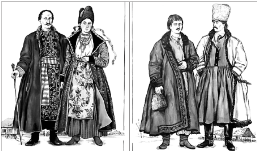
Рис. 1. Реконструкція верхнього вбрання заможних городян кінця XVI–XVII ст. (Білоус, Н. 2021, с. 187)

ман могли підперезати поясом, оздобити чорними шнурами (Чубик, Ю. 2014, с. 87).